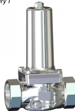
DN 40 - DN 50